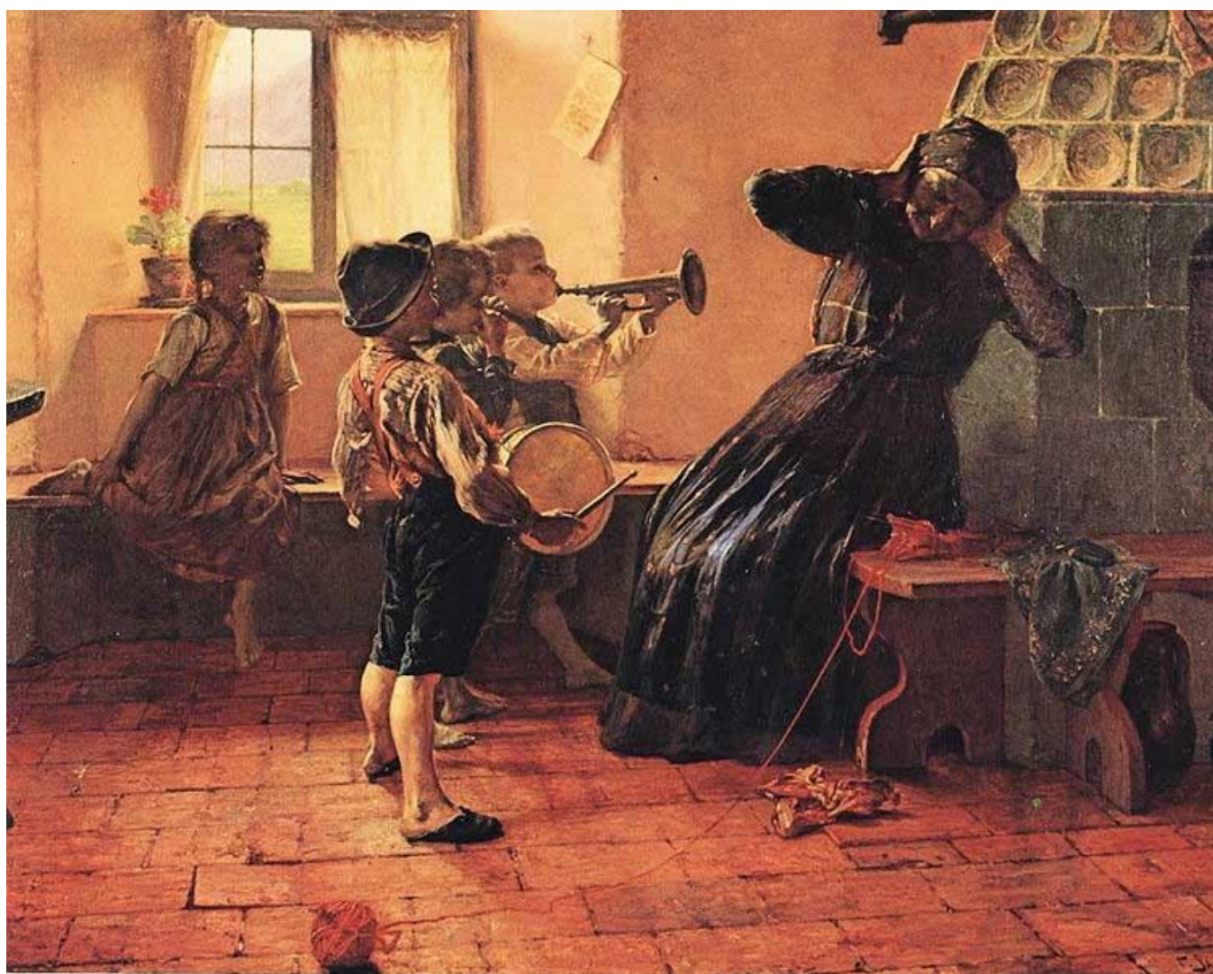
Πίνακας Γ. Ιακωβίδης

Συντάκτες: Λεωνίδα Πανομήτρος, Ουρανία Λαγογιάννη, Λάζαρος Κιwickάκης