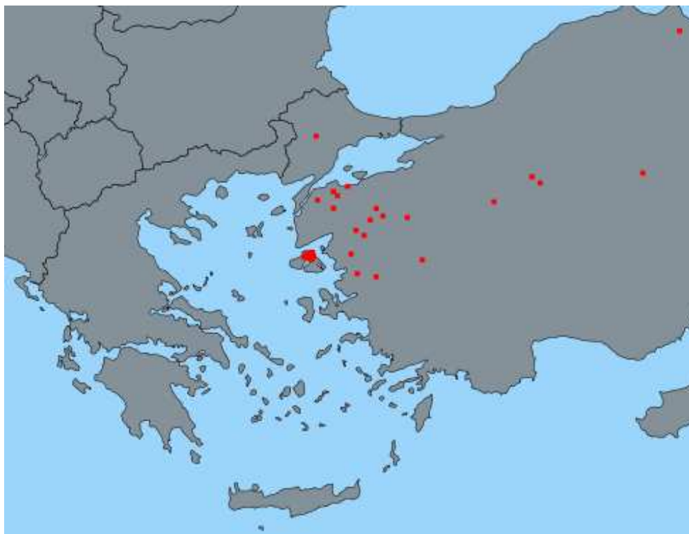
Εικόνα 2 : Εστίες ευλογιάς από 01/10/2017 στη γειτονική Τουρκία.