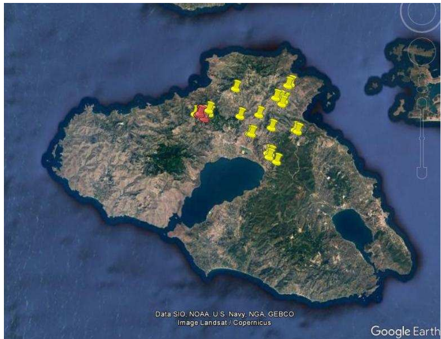
Εικόνα 1. Εστίες Ευλογιάς στη Νήσο Λέσβο, από 07.09.2017 (με κόκκινο χρωματισμό σημαίνουνται οι εστίες από 01.01.2018).