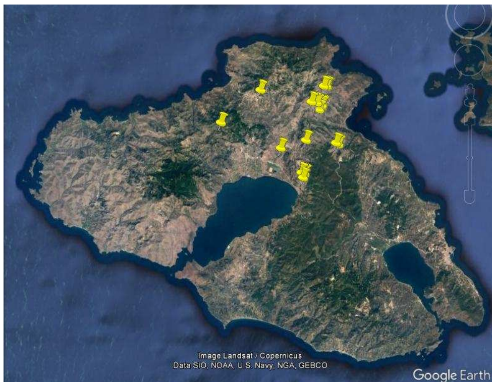
Εικόνα 1. Εστίες Ευλογιάς στην Λέσβο, από 07.09.2017.

Επισημαίνεται ότι απαγορεύεται η έξοδος από νησί της Λέσβου μικρών μηρυκαστικών προς την υπόλοιπη νησιωτική και την ηπειρωτική Ελλάδα. Επιπλέον, από 10.10.2017, απαγορεύεται η μετακίνηση μικρών μηρυκαστικών, σε όλο το νησί, ακόμη και προς τα σφαγεία.