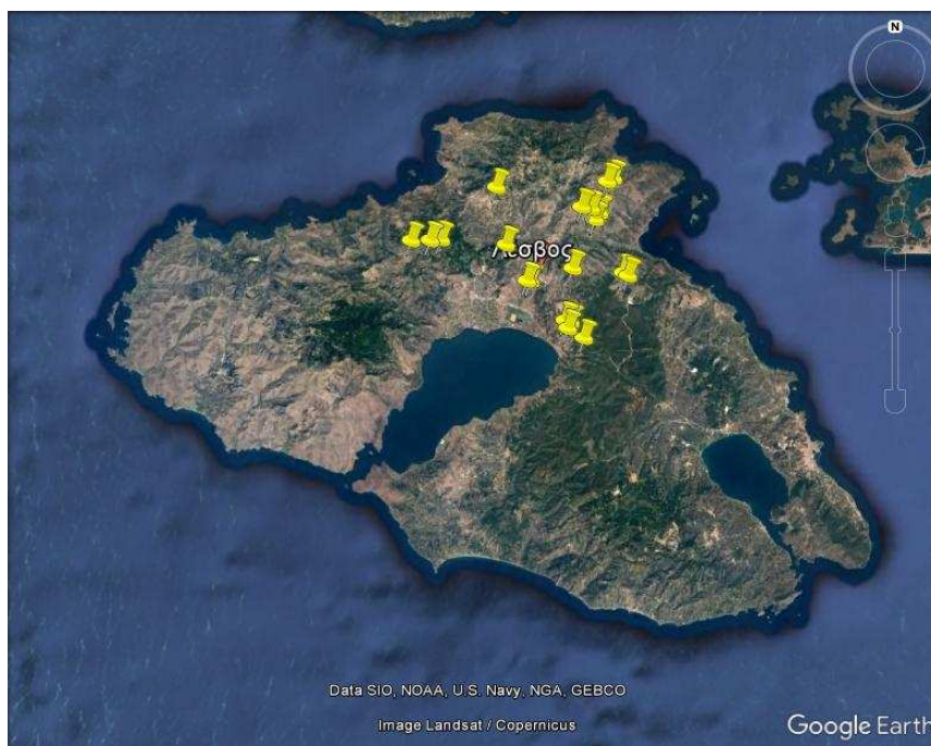
Εικόνα 1. Εστίες Ευλογιάς στην Λέσβο, από 07.09.2017.