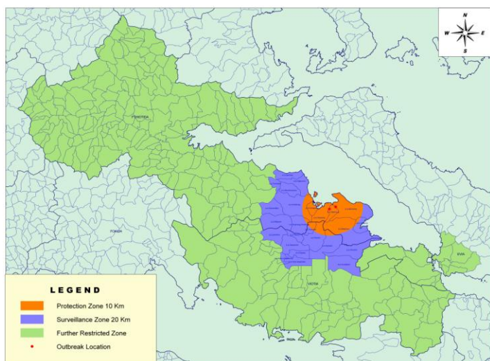
Εικόνα 1. Ζώνες Προστασίας Επιτήρησης και Περαιτέρω Απαγορευμένη Ζώνη στις Π.Ε. Φθιώτιδας, Βοιωτίας και Εύβοιας.

Κατόπιν επιβεβαίωσης εστιών Ευλογιάς των προβάτων και αιγών (ΕΠΑ) σε εκμεταλλεύσεις αιγοπροβάτων αποτελούμενες από 454 πρόβατα στο Δημοτικό Διαμέρισμα Μαλεσίνης και από 257 πρόβατα στο Δημοτικό Διαμέρισμα Τραγάνας, του Δήμου Λοκρών της Περιφερειακής Ενότητας Φθιώτιδας, της Περιφέρειας Στερεάς Ελλάδας, ενσωματώνονται στο Παράρτημα της τροποποιητικής της Εκτελεστικής Απόφασης (ΕΕ) 2023/5725 (Εικόνες 1 και 2 ) και οριοθετούνται οι παρακάτω ζώνες στις Περιφερειακές Ενότητες (Π.Ε.) Φθιώτιδας, Βοιωτίας, Ευβοίας και Λέσβου ως ακολούθως: